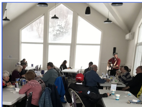
Journée Kell Antoft, Cape Smokey - Mars 2022

Le formulaire de demande d'adhésion se trouve sur notre site Web. Il peut être rempli en ligne ou téléchargé, imprimé et envoyé par la poste au registraire du club.